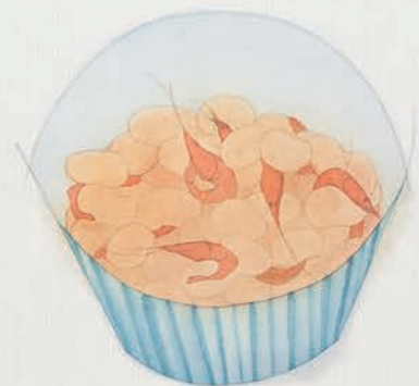
ILLUSTRATION : SHIHO NAITO