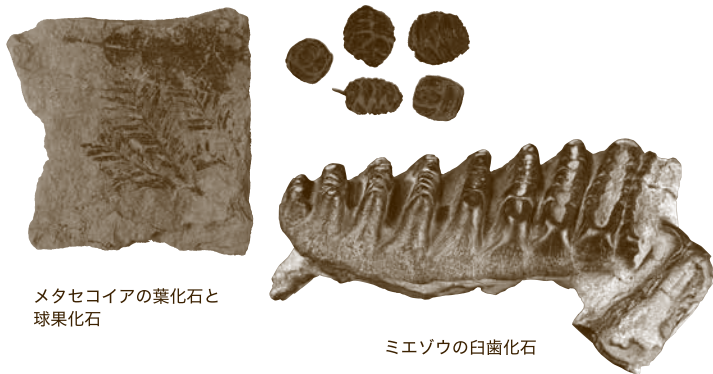
メタセコイアの葉化石と球果化石

化石林はタイムカプセル / 移り変わる 古琵琶湖の森 / 変動する気候と 氷期の森 / 人が暮らしてきた 縄文の森 / 世界の・日本の化石林・埋没林