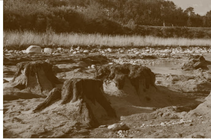
化石林（表裏面）