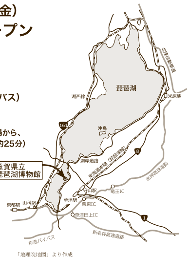
「地理院地図」より作成

TEL 077-568-4811(代表) FAX 077-568-4850 http://www.biwahaku.jp/ 〒525-0001 滋賀県草津市下物町1091番地