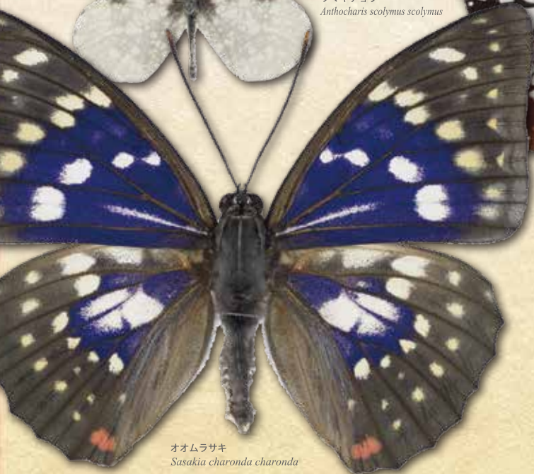
オオムラサキ Sasakia charonda charonda