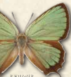
ミドリシジミ Neozephyrus japonicus japonicus