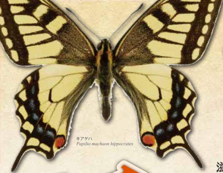
キアゲハ Papilio machaon hippocrates