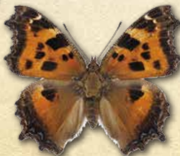
ヒオドシチョウ Nymphalis xanthomelas japonica