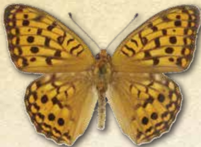
オオウラギンヒョウモン Fabriciana nerippe nerippe