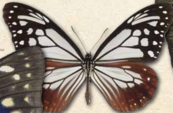
アサギマダラ Parantica sita nipponica