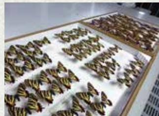
布藤コレクション