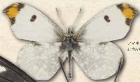
ツマキチョウ Anthocharis scolymus scolymus