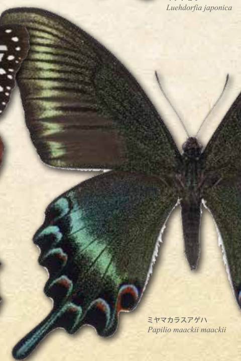
ミヤマカラスアゲハ Papilio maackii maackii