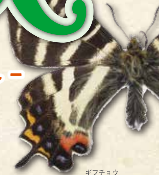
ギフチョウ Luehdorfia japonica