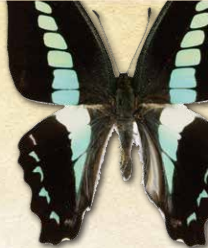
アオスジアゲハ Graphium sarpedon nipponum