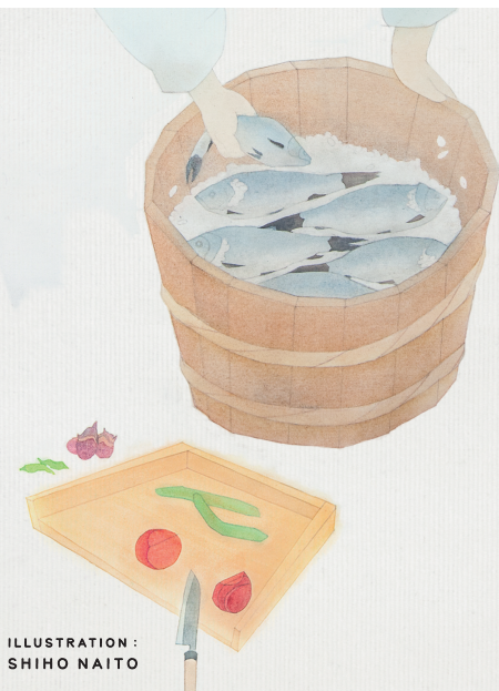
ILLUSTRATION: SHIHO NAITO