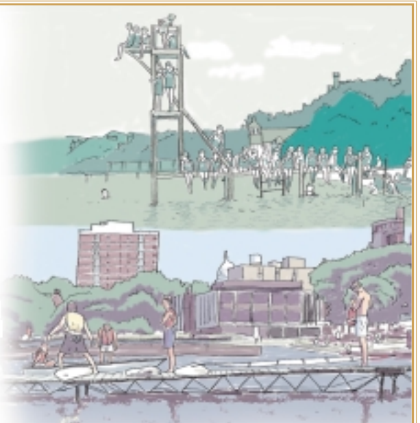
合衆国・マジソン市(メンドータ湖) 上は栈橋と飛び込み台が人気だった昔、現在はセーリングなどが流行している。

マリウイ・マンニ手地区(マリウイ湖) 水汲みは女性や子どもたちの仕事。焼き物のボットよりブリキのバケツが一般的になった。