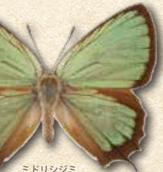
ミドリシジミ Neozephyrus japonicus japonicus