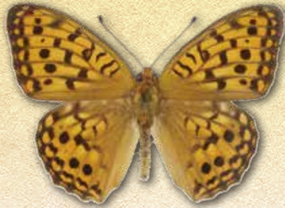
ウラギンビョウモン Fabriciana adippe pallescens