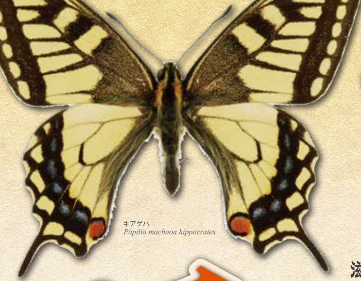
キアゲハ Papilio machaon hippocrates