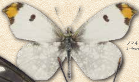
ツマキチョウ Anthocharis scolymus scolymus