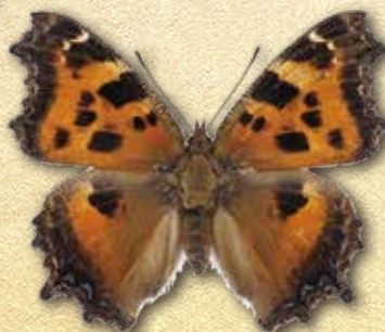
ヒオドシチョウ Nymphalis xanthomelas japonica