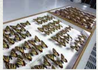
布藤コレクション