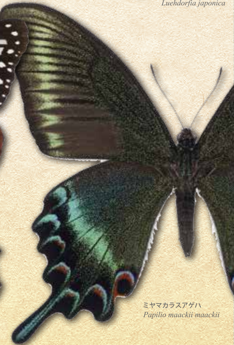
ミヤマカラスアゲハ Papilio maackii maackii