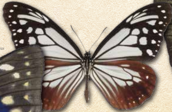
アサギマダラ Parantica sita nipponica