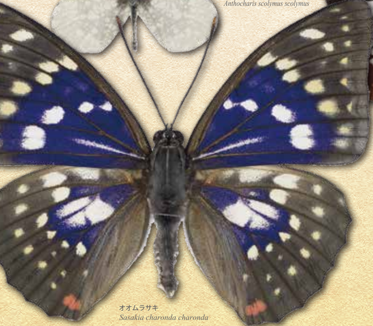
オオムラサキ Sasakia charonda charonda