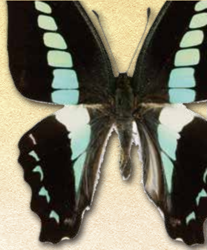
アオスジアゲハ Graphium sarpedon nipponum