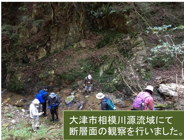
大津市相模川源流域にて断層面の観察を行いました。