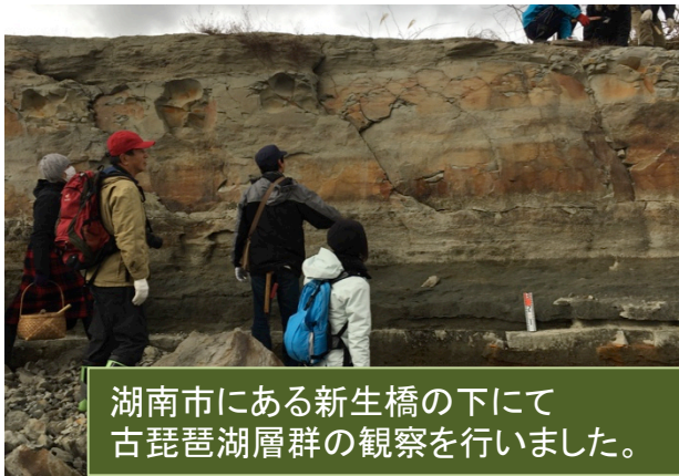
湖南市にある新生橋の下にて古琵琶湖層群の観察を行いました。

夏の暑い時期や冬の寒い時期は、博物館で集まって、岩石薄片作成の実習をしたり、岩石に関する勉強会を行っています。