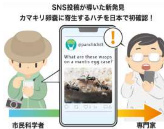
国内2番目の生息地となった神奈川県における発見の経緯 (イメージ図)