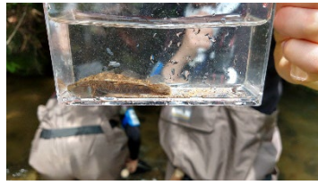
2011-2019 年度 うおの会調査地点(滋賀県域)