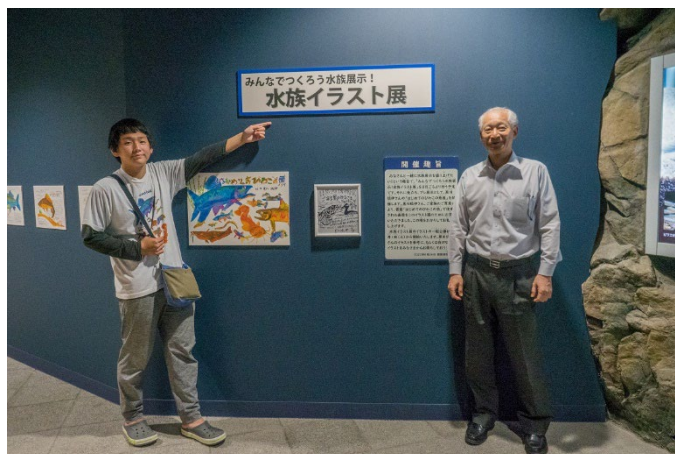
写真3. 水族イラスト展プレ展示の様子 (2023年6月24日)

2023年8月1日～2024年4月7日まで開催していた水族イラスト展のプレ展示として、「はじめてのびわこの魚」のイラストを提供していただきました。水族展示室を利用者の皆様と作り上げていきたいという趣旨で始まった水族イラスト展を盛り上げていただきました。